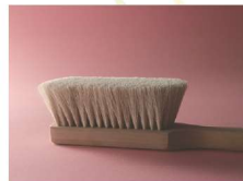
とうきょうてうえぶらし 東京手植ブラシ