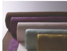
とうきょうむじそめ 東京無地染