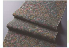
えどさらさ 江戸更紗