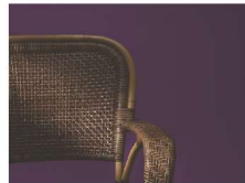
とうきょうとうこうげい 東京籐工芸