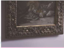
とうきょうがくぶち 東京額縁