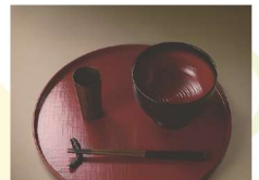
えどしっき 江戸漆器