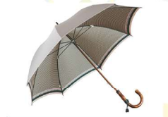
とうきょうようかさ 東京洋傘