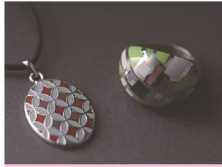
とうきょうしっぽう 東京七宝