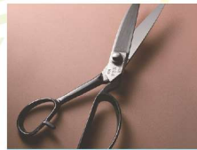
とうきょううちはもの 東京打刃物