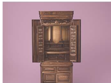
とうきょうぶつだん 東京仏壇