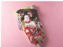
えどおしえはこいた 江戸絵折羽子板