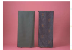
むらやまおしまつむぎ 村山大島紬