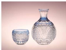
えどきりこ 江戸切り子