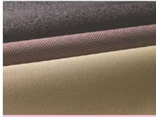
とうきょうそめこもん 東京染小紋