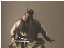
えどいしやうぎにんぎよう 江戸衣裳着人形