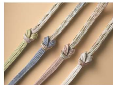
とうきょうくみひも 東京くみひも