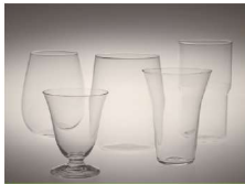
えどがらす 江戸硝子