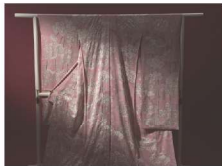
とうきょうてがきゆうぜん 東京手描友禅