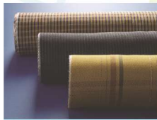
ほんばきはちじょう 本場黄八丈