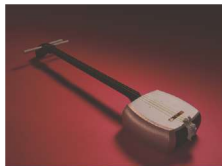
とうきょうしやみせん 東京三味線