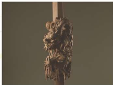
えどもくちようこく 江戸木彫刻