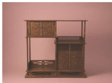
えどさしもの 江戸指物