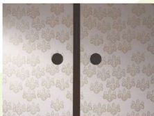
えどからかみ 江戸からかみ