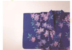
とうきょうほんそめゆかた・てぬぐい 東京本染ゆかた・てぬぐい