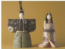
えどきめこみにんぎよう 江戸木目込人形