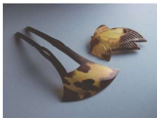
えどべっこう 江戸鼈甲