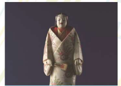
えどぞうげ 江戸象牙