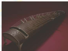
とうきょうこと 東京琴