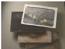
えどもくはんが 江戸木版画