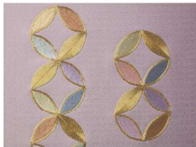
えどししゅう 江戸刺繍