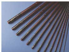
えどわざお 江戸和竿