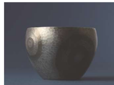
とうきょうぎんぎ 東京銀器