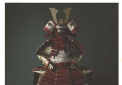
えどかつちゆう 江戸甲冑