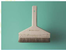
えどはけ 江戸刷毛