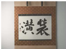
えどひやうぐ 江戸表具