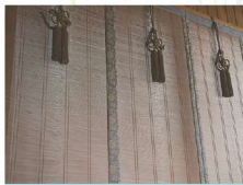
えどすだれ 江戸簾