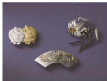
とうきょうちようきん 東京彫金