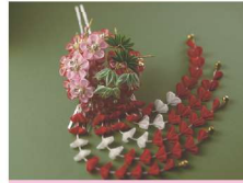
えどつまみかんざし 江戸つまみ簪