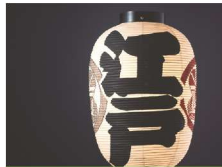
えどてがきちようちん 江戸手描提灯