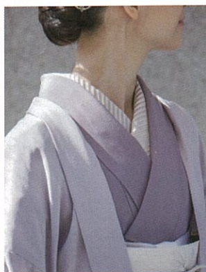
無地染の一ツ紋付